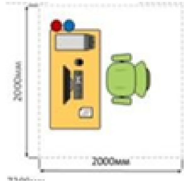
Рабочее место участника (2X2 м) в составе: стол; стул; компьютер; монитор; клавиатура; мышь; USD-накопитель; набор ПО